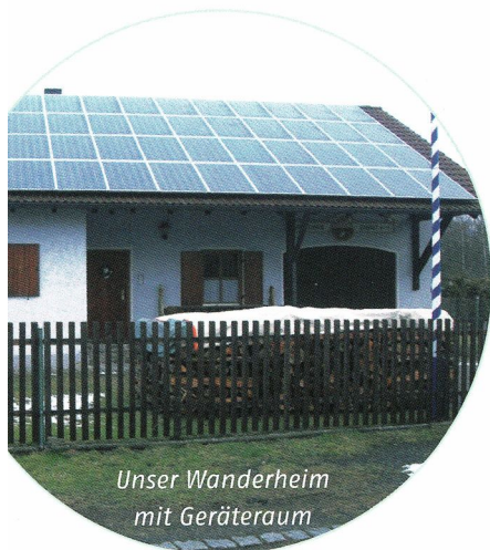
Unser Wanderheim mit Geräteraum