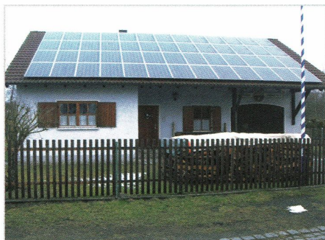
Unser Wanderheim mit Geräteraum